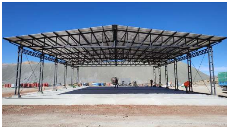
Obra Mina Pirquitas

Nos encargamos de proyectos llave en mano , desde los cimientos hasta la cubierta, pasando por redes de incendio, redes de servicios, pavimentos de accesos, etc.