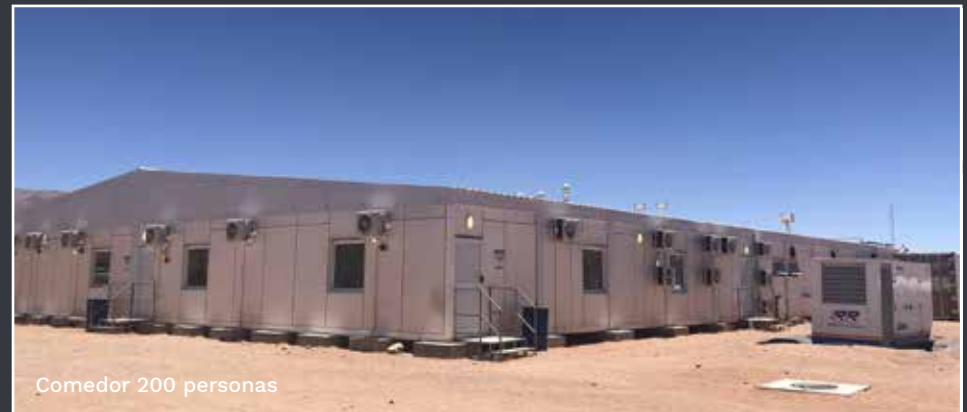
Comedor 200 personas

Comedores para abastecer en sitios remotos, o donde no tengamos las instalaciones ni los proveedores, a comensales que necesiten del servicio en sitio. Estos Complejos se entregan totalmente equipados con cocinas, depósitos, cámaras de frío, hornos, etc.