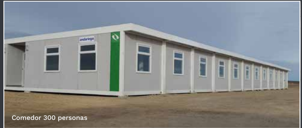
Comedor 300 personas