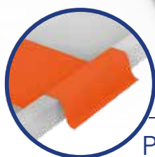
Protector opcional para rodados

Lona PVC con filtro UV y alta resistencia a la tracción y al desgarro